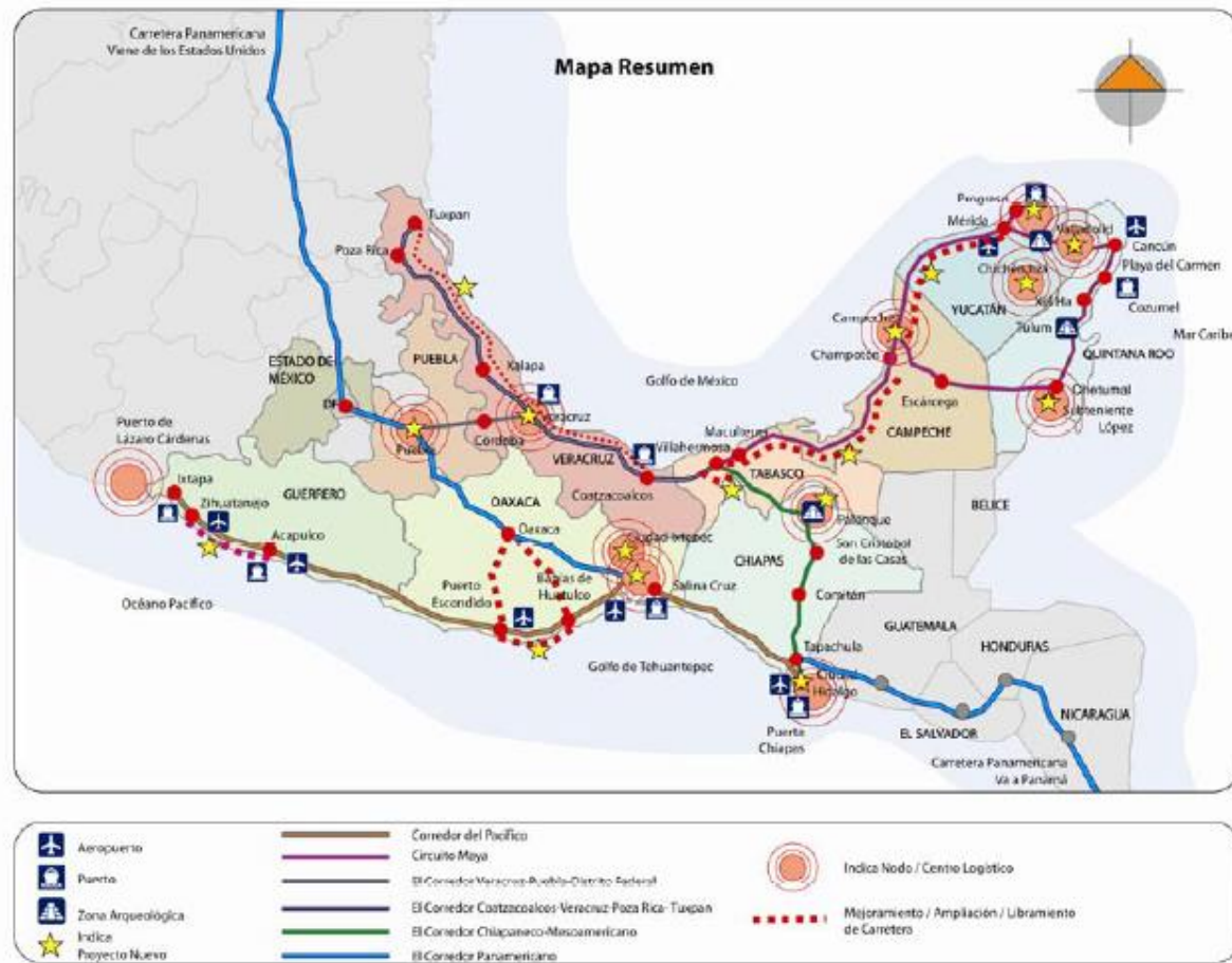
Mapa 1: Corredores Logísticos del Sur Sureste, IDOM 2010.