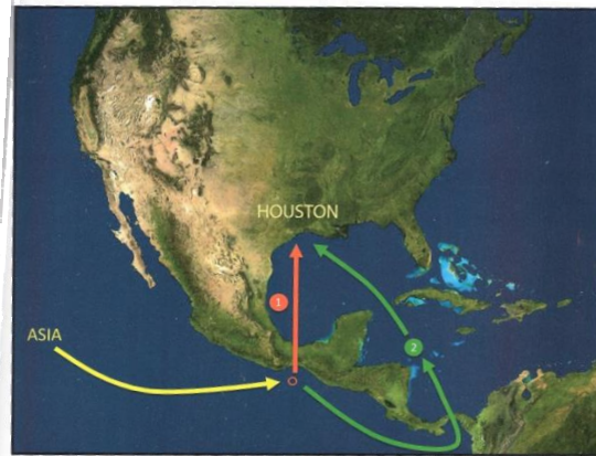
Mapa 3: Corredor Logístico Istmo de Tehuantepec, M. Theurel, 2013.