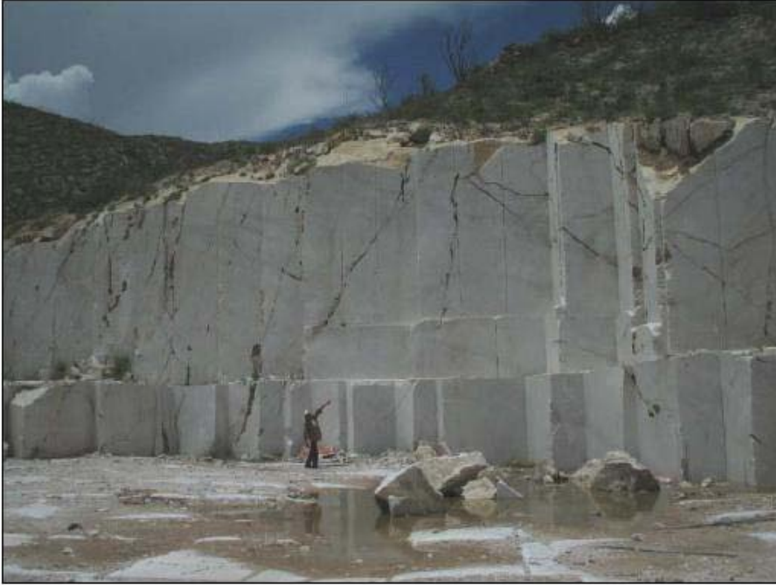
Banco de mármol de la localidad 30 de Noviembre, Mpio. Mapimí, Dgo.