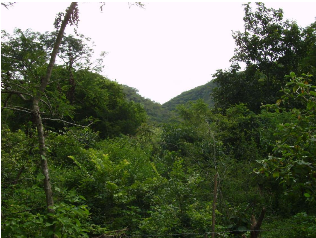
Panorámica que muestra al fondo el prospecto Agua Dulce, donde se encuentran dos lomas con depósito de yeso para su explotación inmediata