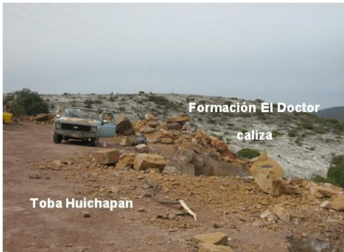
Panorámica del banco de toba ignimbrítica riolítica Don Daniel Municipio de Huichapan, Hidalgo.