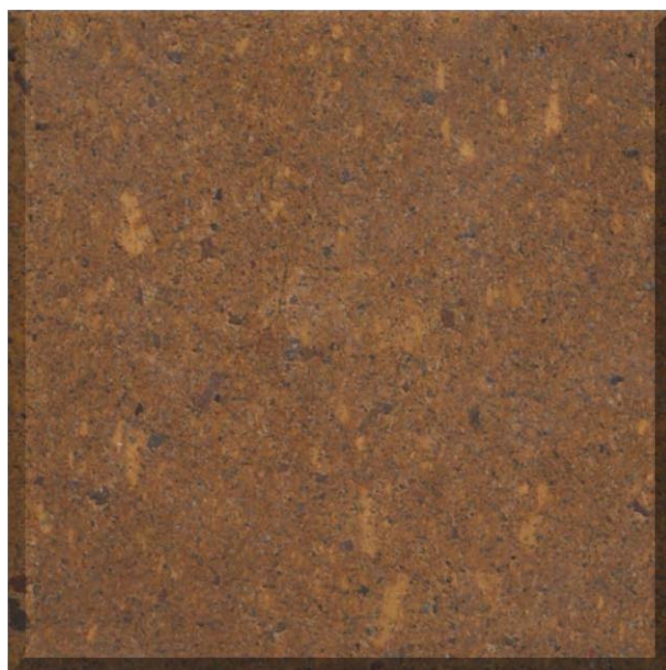
Mosaico laminado y pulido de ignimbrítica riolítica color amarillo ocre, con fragmentos de rocas volcánicas. La respuesta al corte es buena, presenta aristas sanas y buena apariencia estética..