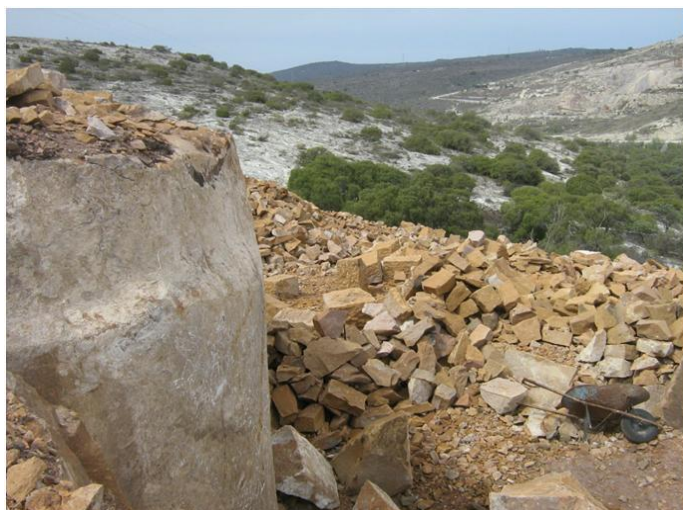
Detalle del banco de toba ignimbrítica riolítica Don Daniel, Municipio de Huichapan, Hidalgo.