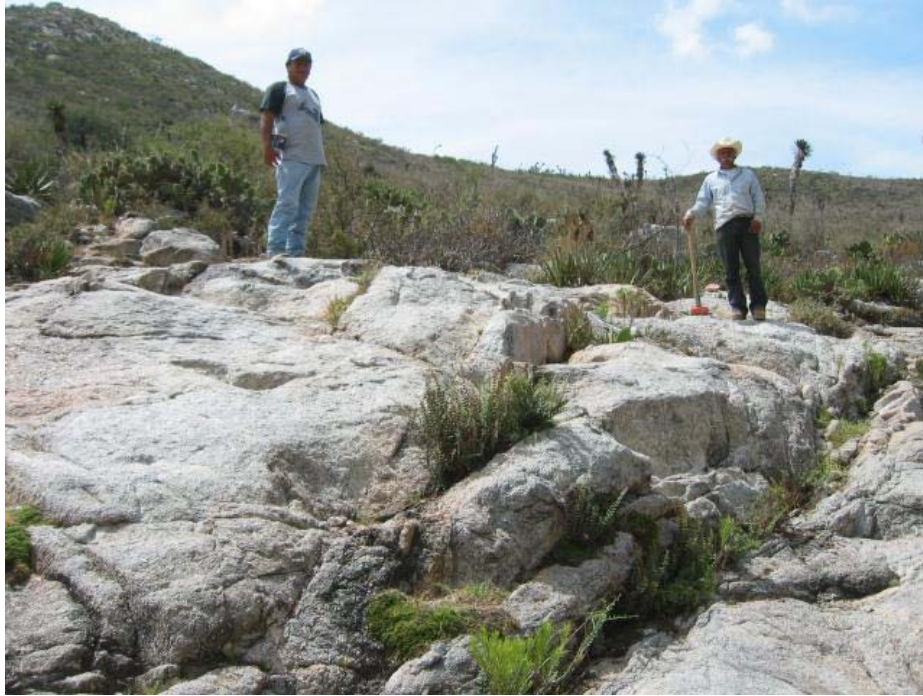
Afloramiento de sienita en la localidad El Cercado, Mpio., Saltillo Coahuila