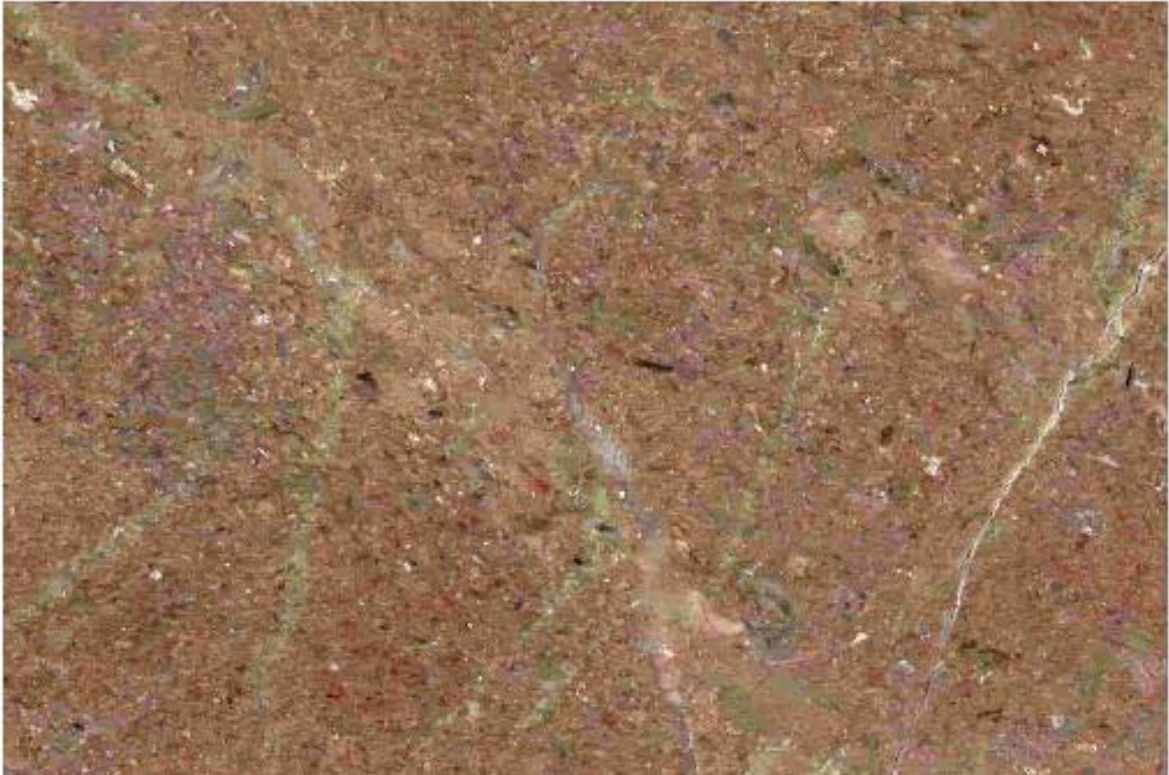
Mosaico de caliza marmorizada (mármol) del ejido La Pólvora con buen pulido y brillo