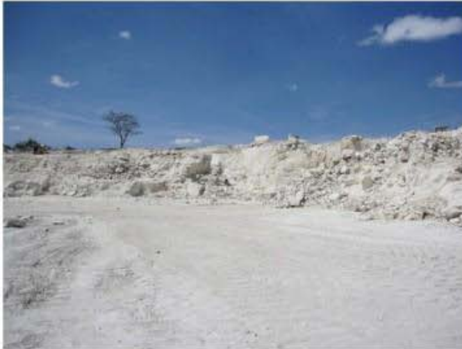
Panorámica de la cantera Maguey Santo 1, Municipio Tepexi de Rodríguez, Puebla.