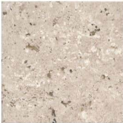
Mosaico cortado y laminado que muestra las buenas características físicas de brillo y pulido.