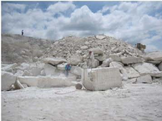
Tajo y bloques de travertino cortados con barrenación corta, en la localidad Maguey Santo 1.