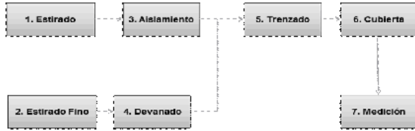
Diagrama 1. Proceso de producción de cable coaxial