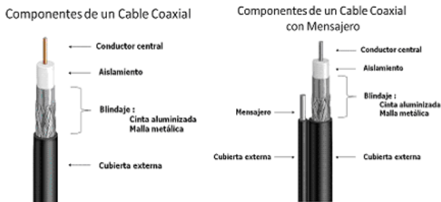
Ilustración 1. Componentes de los cables coaxiales RG